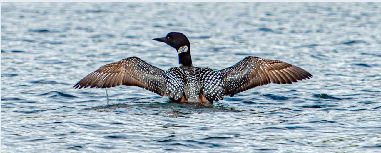
HUARD - LOON

Pour faire un don veuillez visiter/To donate please visit: www.conservationmanitou.ca