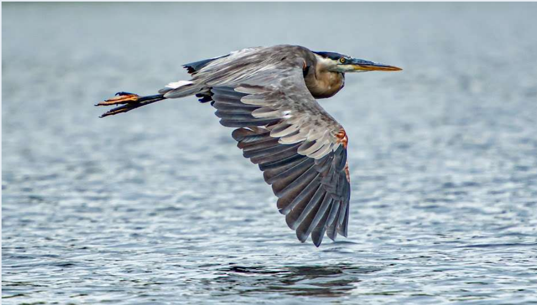
GRAND HERON - GREAT BLUE HERON